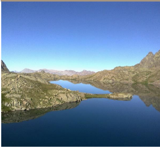
Lac RABUONS, une mer en montagne, commune de Saint Étienne de Tinée