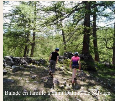
Balade en famille à Saint Dalmas Le Selvage

J'avais envie de vivre hors de la ville, de retrouver un sens naturel à ma vie, mon travail. Je me suis installée dans le Nord de la Vallée il y a 15 ans et je suis toujours amoureuse de ces paysages... J'oriente désormais les visiteurs vers nos plus belles destinations. Mes enfants vont à l'école à Saint Étienne de Tinée. C'est une petite école et les professeurs sont très investis, mon petit dernier avait des difficultés scolaires et tout a été mis en œuvre rapidement pour l'accompagner de façon personnalisée. Les deux collègues du secteur offrent à nos ados le ski gratuit avec l'équipement ! Où trouver un environnement pareil avec en plus la mer à 1 heure de route ?