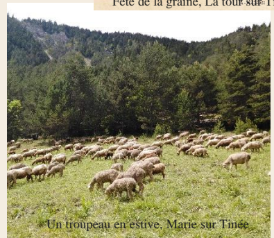
Un troupeau en estive, Marie sur Tinée